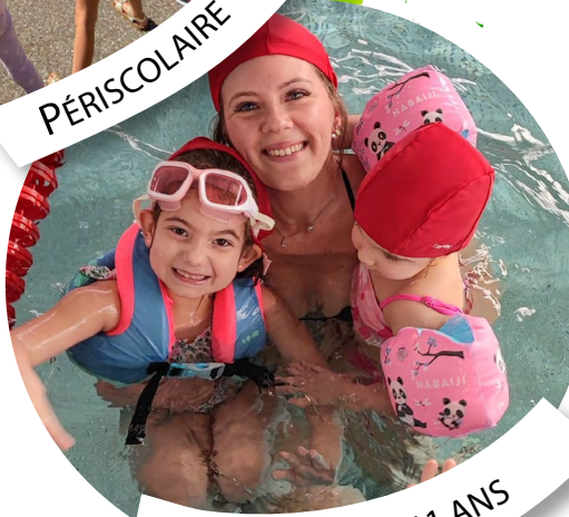
VACANCES 3-11 ANS