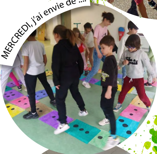
MERCREDI, j'ai envie de ....