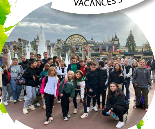
VACANCES 12-17 ANS